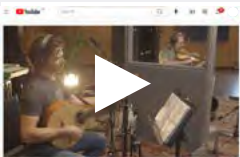
Vidéo promotionnelle 20 PRINTEMPS

Le Vent du Nord, quintette folk/trad de renommée internationale, célèbre son 20 e anniversaire avec le lancement de l'album 20 PRINTEMPS le 28 janvier. Ce groupe offre un 11 e album qui fait du bien. 20 PRINTEMPS , c'est se renouveler constamment, regarder en avant et festoyer en grand! Sous le signe de l'amitié et du partage, Le Vent du Nord vous invite à découvrir douze pièces et chansons qui touchent le cœur et qui le rendent surtout plus léger.