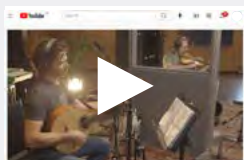
Vidéo promotionnelle 20 PRINTEMPS

Les festivités seront lancées en janvier prochain avec le lancement du 11 e album à Glasgow en Écosse. Le groupe présentera une tournée spéciale 20 e anniversaire notamment en France, aux États-Unis et au Royaume-Uni avant de s'arrêter au Canada.