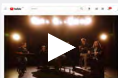
Prestation Le Vent du Nord - Ma Louise

Le lancement international de l'album 20 PRINTEMPS se tiendra à Boston le 4 février. Le groupe présentera ensuite une tournée spéciale 20 e anniversaire notamment aux États-Unis et au Royaume-Uni avant de s'arrêter au Québec. La première montréalaise du nouveau spectacle se tiendra le vendredi 27 mai au Théâtre Plaza.